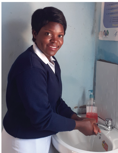
Un sistema de agua por tubería que funciona con energía solar proporciona agua para lavado de manos que salva vidas en la clínica de Kanyongola.

World Vision buscará todas las oportunidades para desarrollar la capacidad del gobierno, el liderazgo comunitario y las empresas privadas en los países y áreas donde trabajamos para servir a sus ciudadanos. La asociación con el gobierno respalda estratégicamente sus esfuerzos para llevar los servicios WASH a todas las comunidades y equiparlas con las herramientas y sistemas para la operación y el mantenimiento continuos de esos servicios.