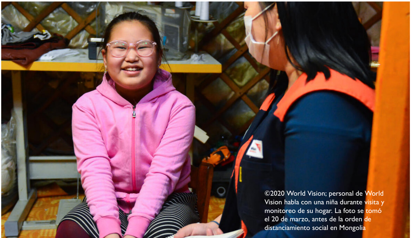
personal de World Vision habla con una niña durante visita y monitoreo de su hogar. La foto se tomó el 20 de marzo, antes de la orden de distanciamiento social en Mongolia.

Para muchos niños, la violencia que experimentan como resultado del COVID-19 no será temporal. Puede que las cosas nunca vuelvan a la "normalidad", y millones de niñas y niños queden atrapados en los ciclos de violencia, lo que limitará su potencial y retrasará el progreso hacia un futuro más pacífico, inclusivo y sostenible.