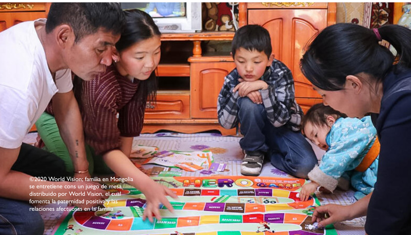
familia en Mongolia se entretiene con un juego de mesa distribuido por World Vision, el cual fomenta la paternidad positiva y las relaciones afectuosas en la familia