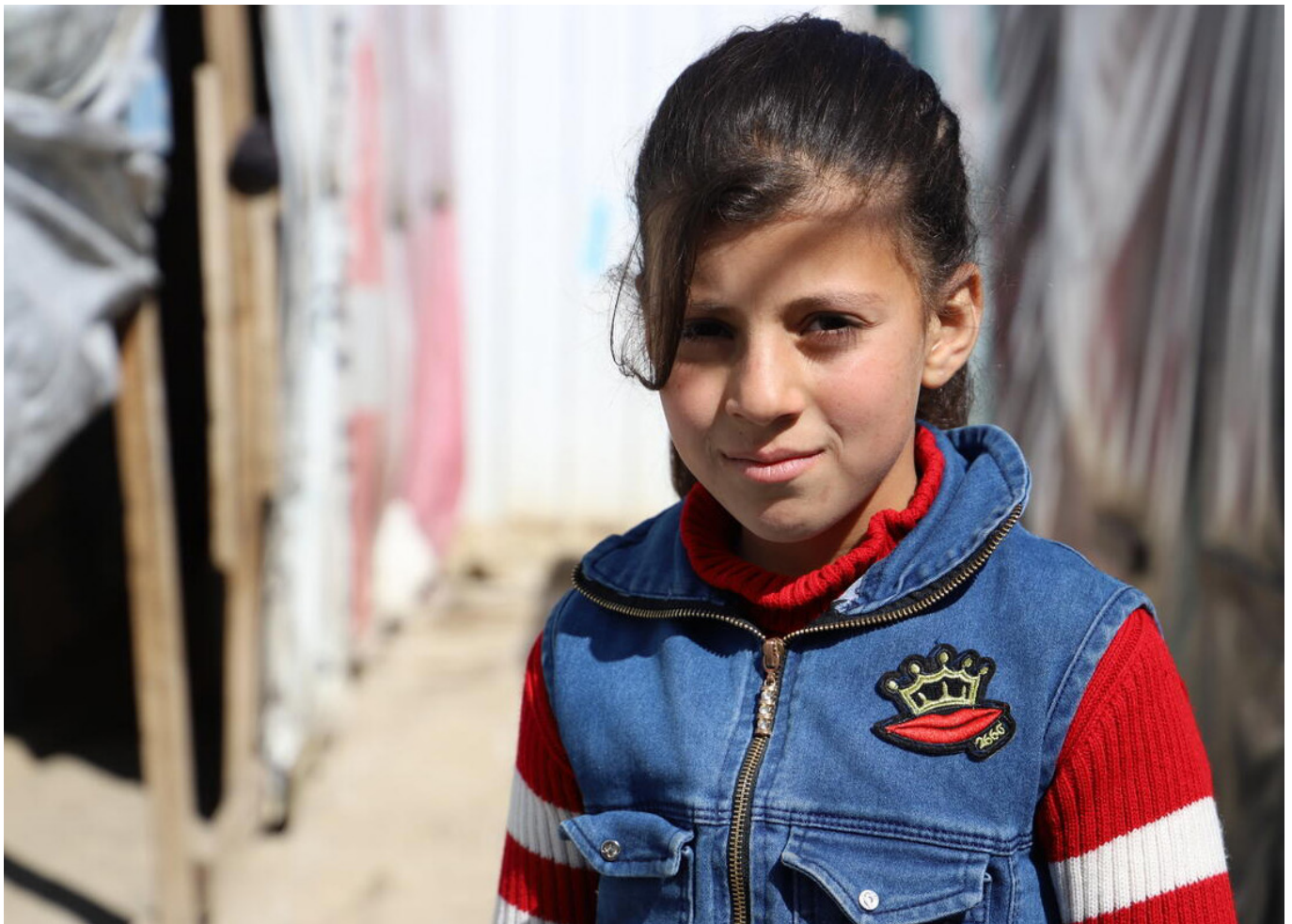
refugiados sirios y el miedo al COVID-19: "No estamos dispuestos a subestimarlos, y los bombardeos no fueron tan aterradores!"

afectados por conflictos armados y donde los impactos a largo plazo de el COVID-19 pueden ser máximos. Estudios recientes de los datos de la Ayuda Oficial al Desarrollo calculan que menos del 0,6 % del gasto mundial total y el 0,5 % de la financiación humanitaria mundial se destinan a poner fin a la violencia contra la infancia. x